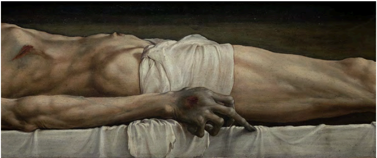
Jacqueline Salmon. Le point aveugle . Holbein. © Jacqueline Salmon 2022 [Hans Holbein le Jeune, Christ mort au tombeau , 1521. Kunstmuseum, Bâle].