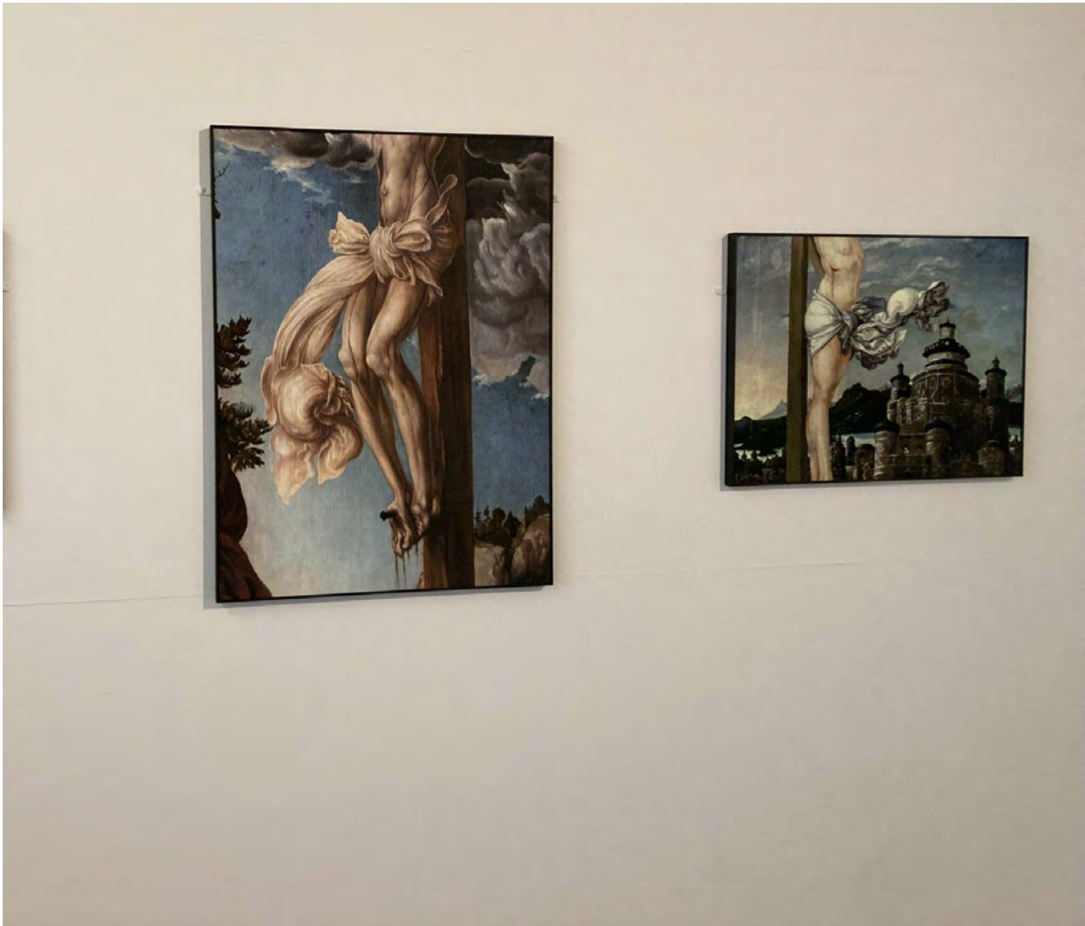
Jacqueline Salmon, Lucas Cranach l'Ancien, Crucifixion, 1503 . Munich, Alte Pinakothek // Wolfgang Huber, Allégorie de la Rédemption (?) , 1543. Vienne, Gemäldegalerie