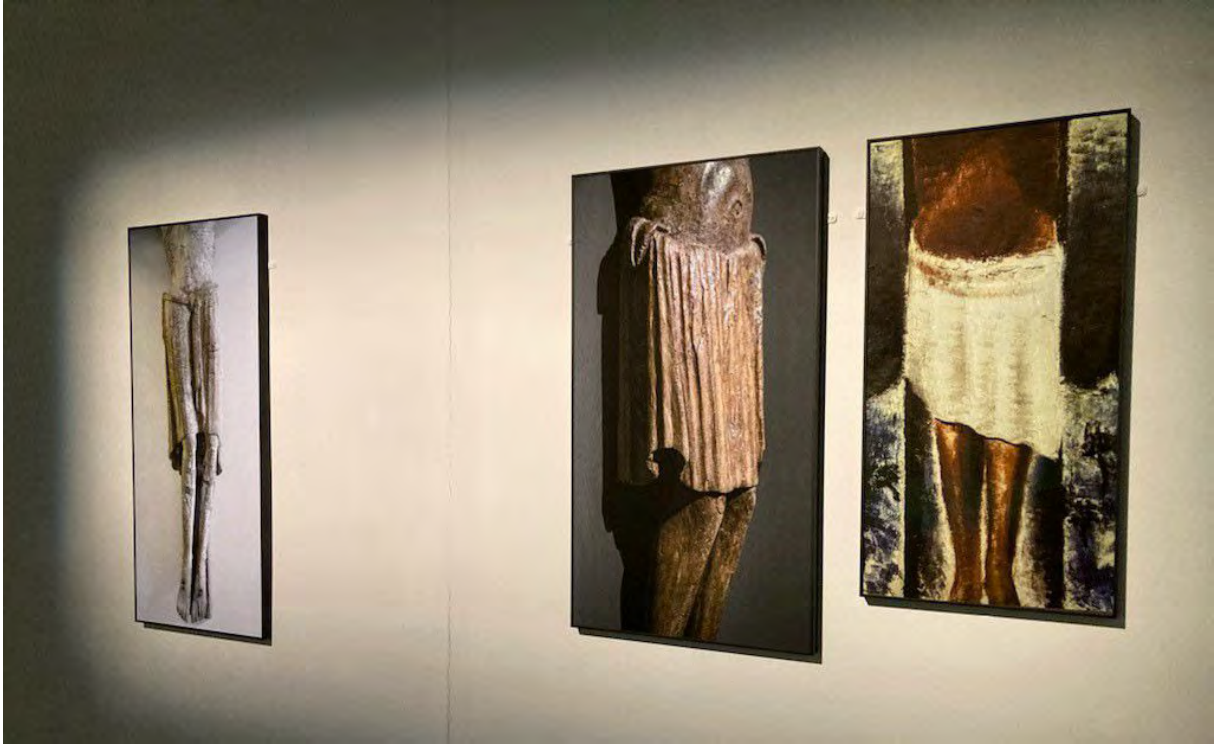
Jacqueline Salmon, Christ crucifié , atelier inconnu, ca. 1200. Bois polychrome. Fribourg, musée d'Art et d'Histoire // Jean Fautrier, Christ en croix , 1929. Huile sur toile. Vatican, Musei Vaticani © photographie Marie-Christine Sentenac, Arles, musée Réattu, juillet 2022.

N'avez-vous pas été effrayée par l'ampleur de la tâche ?