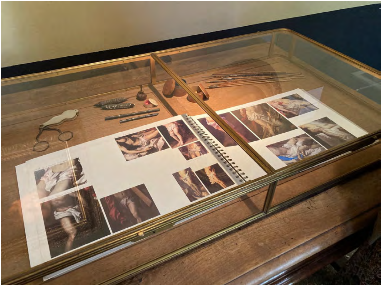
Jacqueline Salmon, carnet d'études, montage de photographies © photographie Marie-Christine Sentenac, Arles, musée Réattu, juillet 2022.

Le point aveugle du titre fait référence à la tâche de Mariotte, seul endroit aveugle de la rétine. Pourquoi, cette étoffe qui cache les genitalia du Seigneur a-t-elle été ainsi ignorée, pudeur, pudibonderie ou gêne par rapport à la nature du Christ, humain, donc pourvu de tous les attributs sexuels - comme chez Michel-Ange qui n'hésite pas à le représenter nu - ou divin et donc absout du péché originel ?