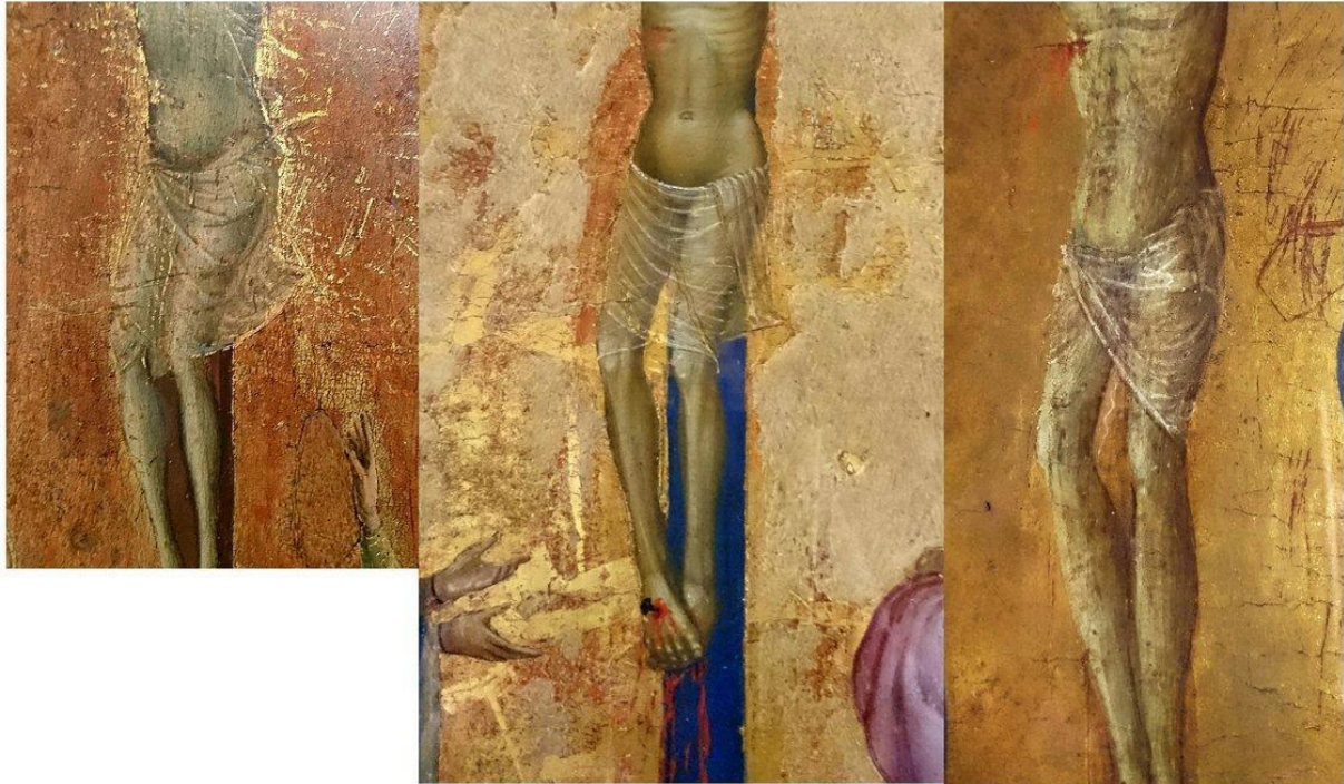
Les suggestions de l'Italie du XIVe siècle. Jacqueline Salmon, Musée Réattu, Arles 2022.

que la décence m'interdit de nommer. Chez l'un des Carrache enfin, comme chez d'autres, il existe une solution de continuité. Le pagne se voit interrompu, une cordelette ficelée autour de la taille le maintenant en place. On se croirait ici dans une photo de «Playboy» des années 1960. Un peu de nudité suggère le tout.