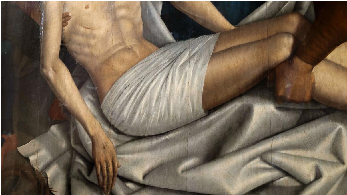
Jean Fouquet. Un goût général pour le blanc. Jacqueline Salmon, Musée Réattu, Arles 2022.

«Le point aveugle», Musée Réattu, 10, rue du Grand-Prieuré, Arles, jusqu'au 2 octobre. Tél. 00334 90 49 37 58, site www.museereattu.arles.fr Ouvert du mardi au dimanche de 10h à 18h. L'exposition est accompagnée d'un film de Samuel Fleury, d'une durée de 54 minutes. Il était désactivé lors de mon passage.