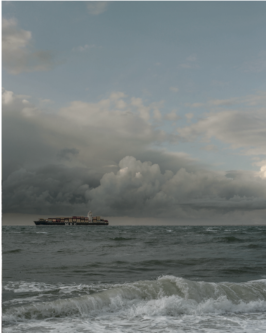
«Marine avec porte-conteneurs», 2016. «C'est tout simplement une marine faite au Havre.»