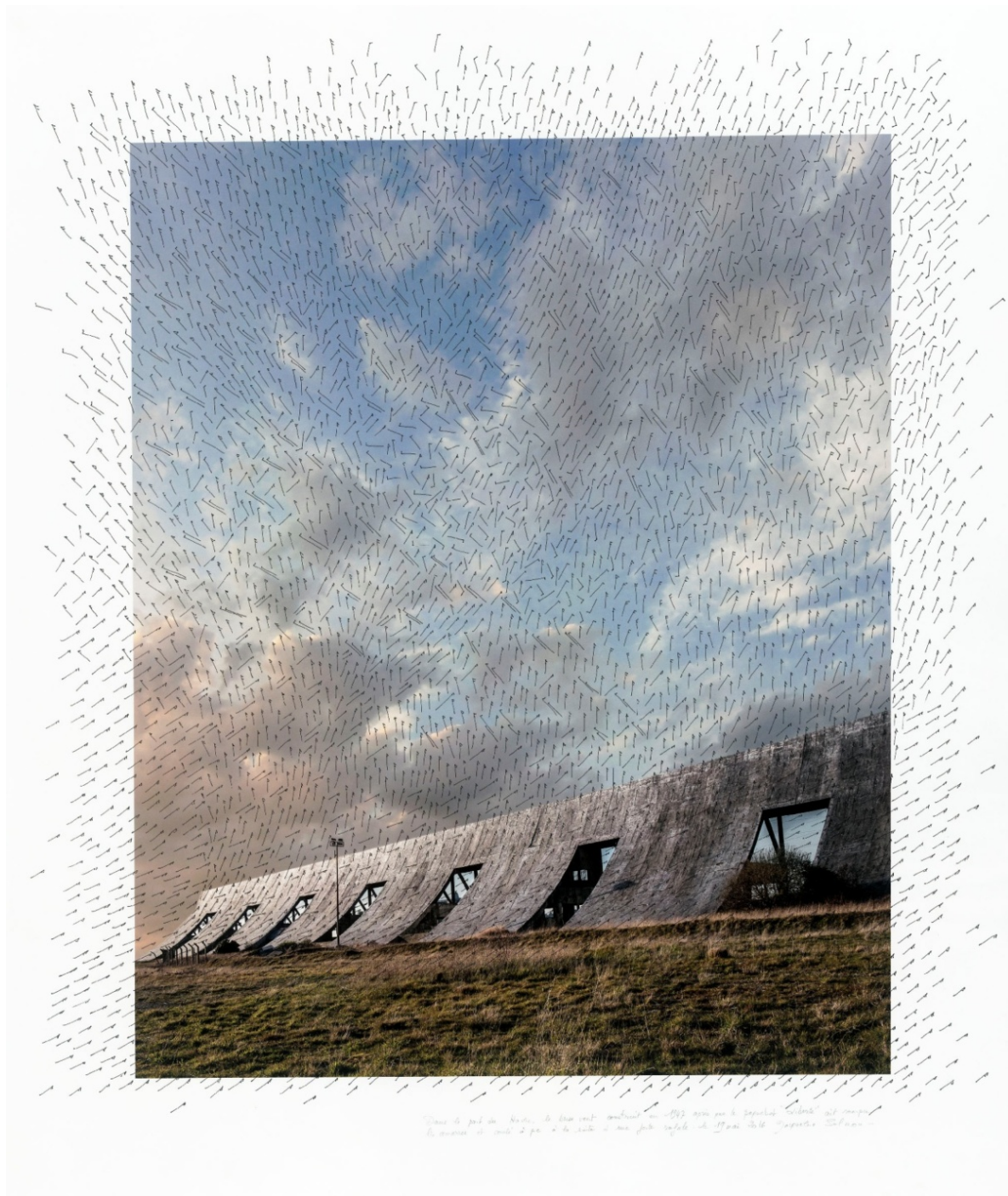
«Brise-vent, quai Mazeline, Le Havre, carte des vents», 2016. «Le brise-vent a été construit en 1947 pour protéger les paquebots à quai des vents violents après le naufrage du "Liberté" dans le port, en 1946. J'ai dessiné à l'encre de Chine une carte des vents déviés par cette étrange construction.»