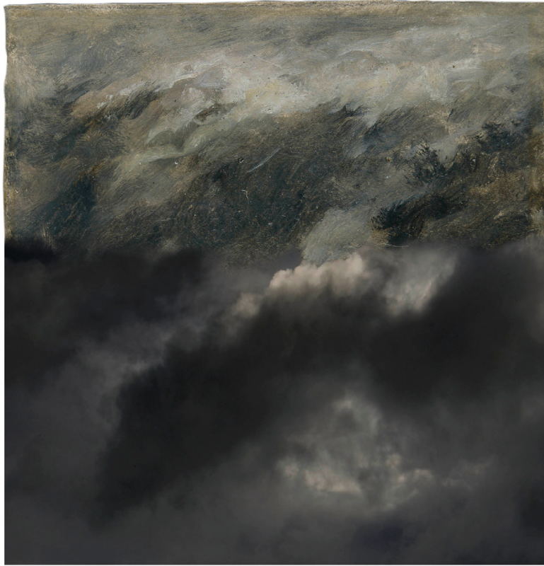
«Ciel noir avec Boudin», 2016. «L'ensemble de cette exposition est dédié à Eugène Boudin. Ici, c'est l'incrustation d'une de ses études de ciel, avec une des photographies de ma collection de nuages.»