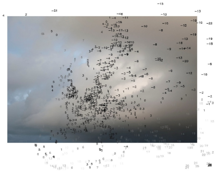
«Relevé des températures sur le site en Europe le 11 février 2010 à 8h55.» «J'ai trouvé ces relevés sur le site allemand Wetterzentrale. J'utilise toujours des données météorologiques officielles.»