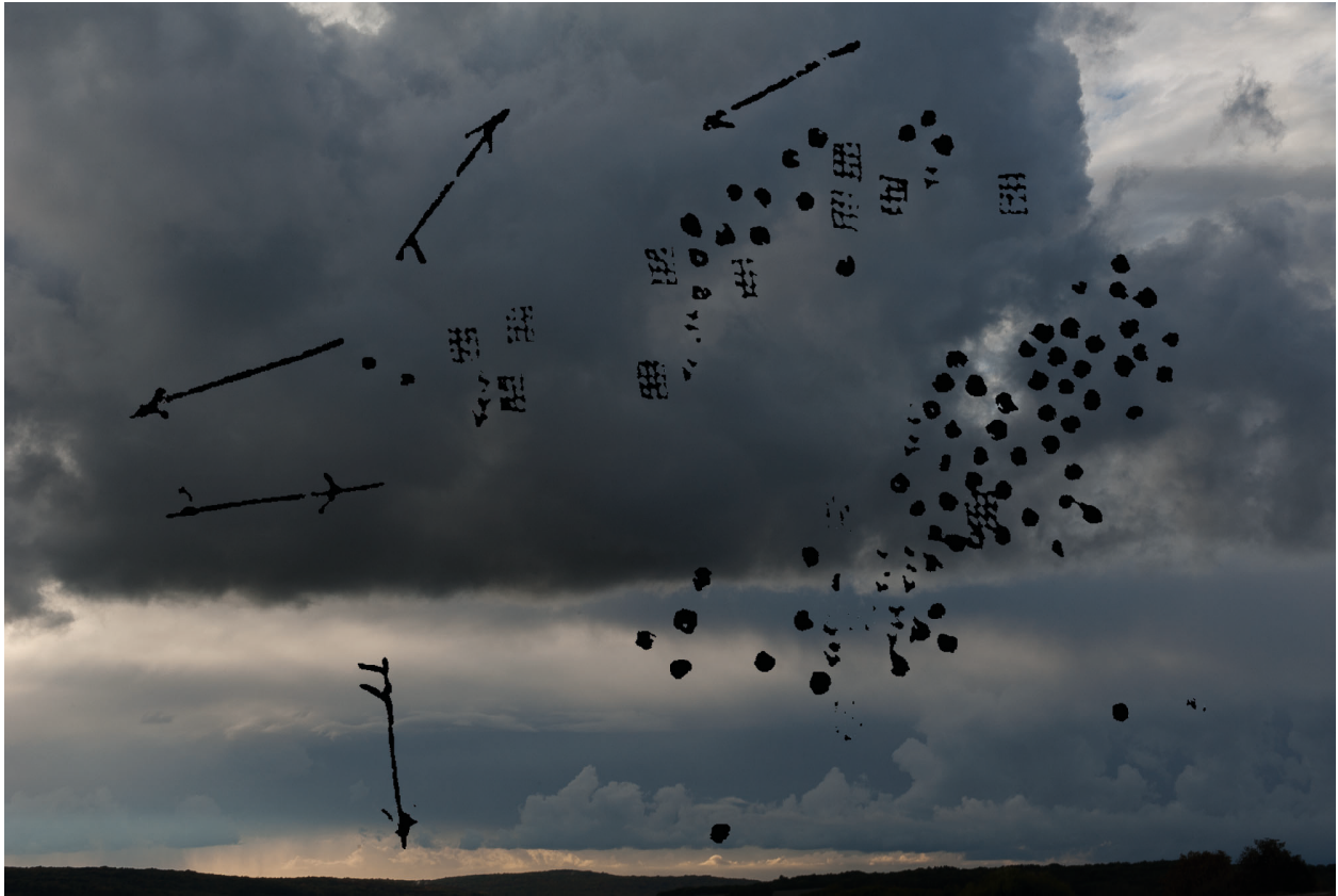
«Orage numéro 1», 2012-2016. «J'ai découvert ces données météorologiques dans un "livre des orages " de l'époque d'Eugène Boudin, conservé à la bibliothèque de l'Observatoire à Paris. Elles sont reproduites sur un ciel d'orage de l'estuaire de la Seine.»